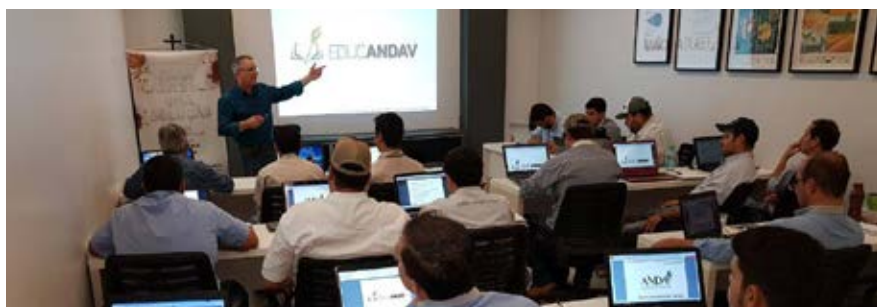
EDUCANDAV in Company