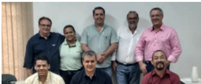
Comitê de Finanças realizado em setembro em Campinas